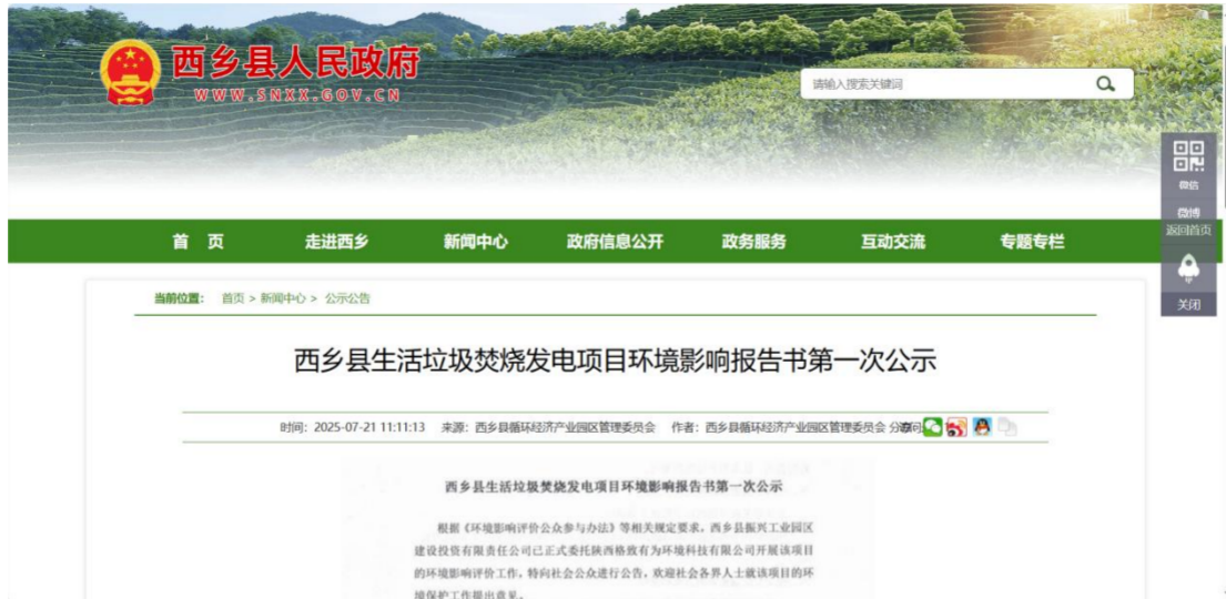
图 2-1 第一次网络公示截图