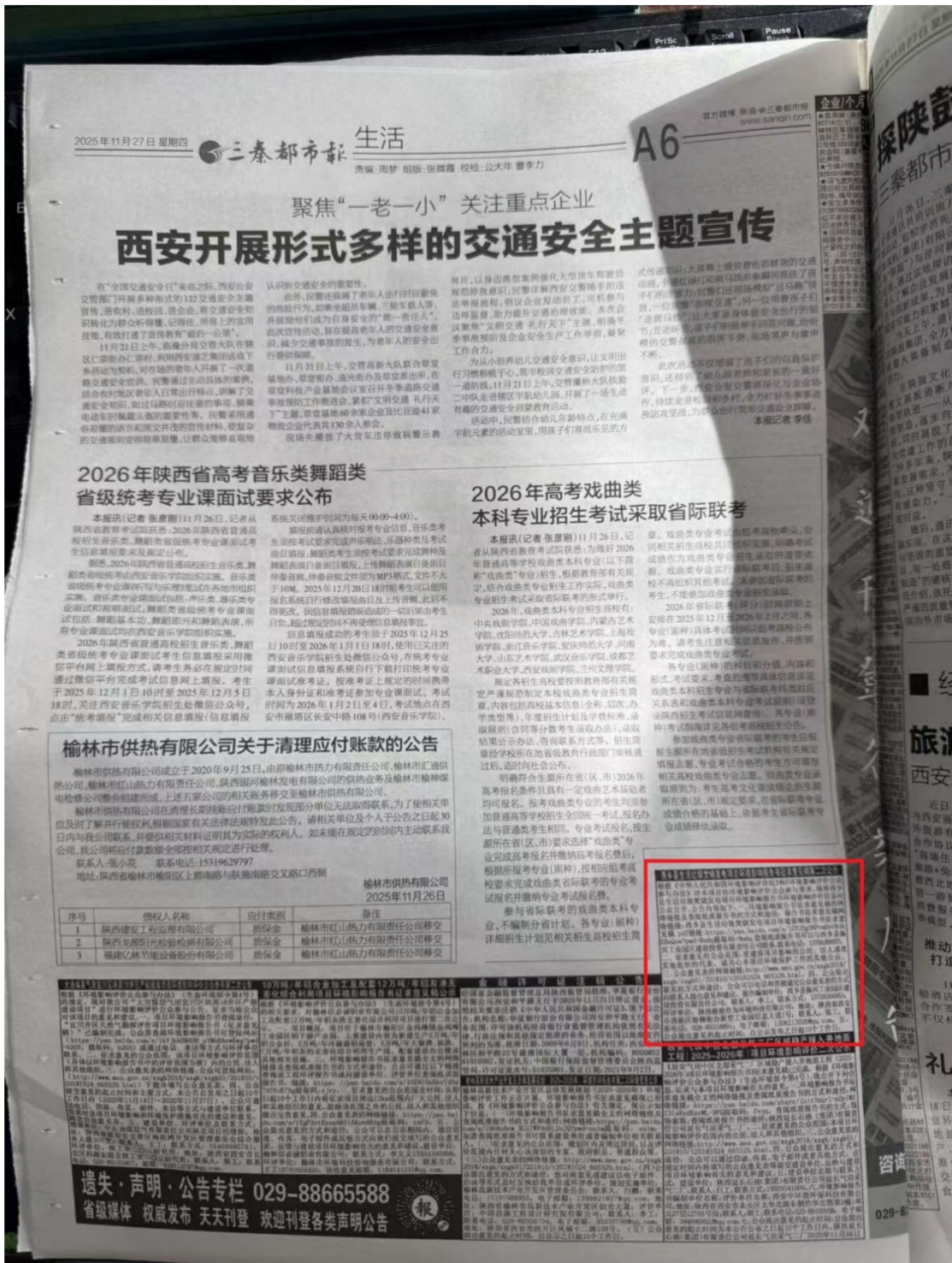
图 3-3 2025 年 11 月 27 日报纸公式截图