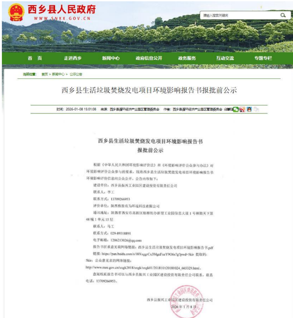
图 6-1 项目报批前公示截图