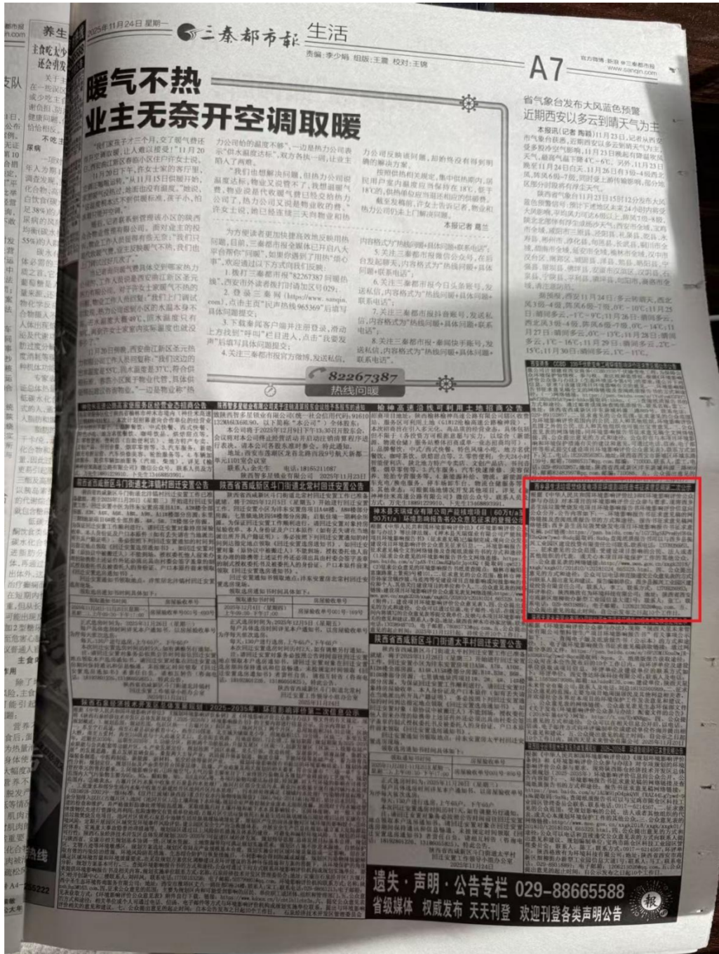
图 3-2 2025 年 11 月 24 日报纸公示截图

在西乡县生活垃圾焚烧发电项目环境影响报告书编制完成后，2025年11月24日和2025年11月27日，我单位先后两次在《三秦都市报》进行了《西乡县生活垃圾焚烧发电项目环境影响评价公众参与信息第二次公示》，公示时间为10个工作日，符合《环境影响评价公众参与办法》（2019）要求。截图见图3-2和图3-3。