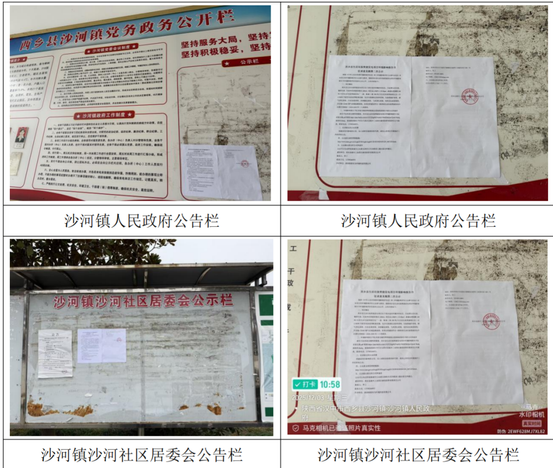
图 3-4 现场张贴照片

息第二次公示》。公告张贴在厂区门口和主要环境敏感点附近，符合《环境影响评价公众参与办法》（2019）要求。现场张贴照片见图 3-4 所示。