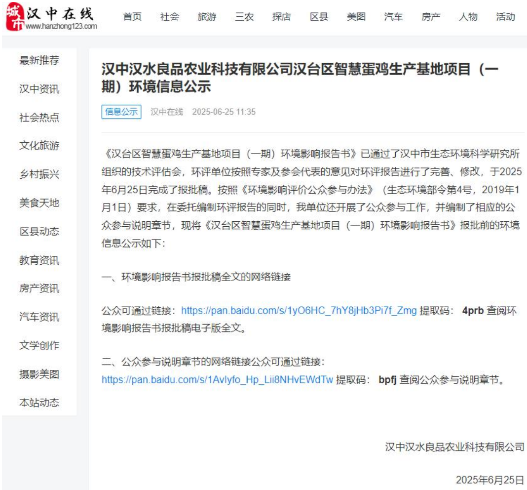
图 7 报批稿完成之后的网络公示截图