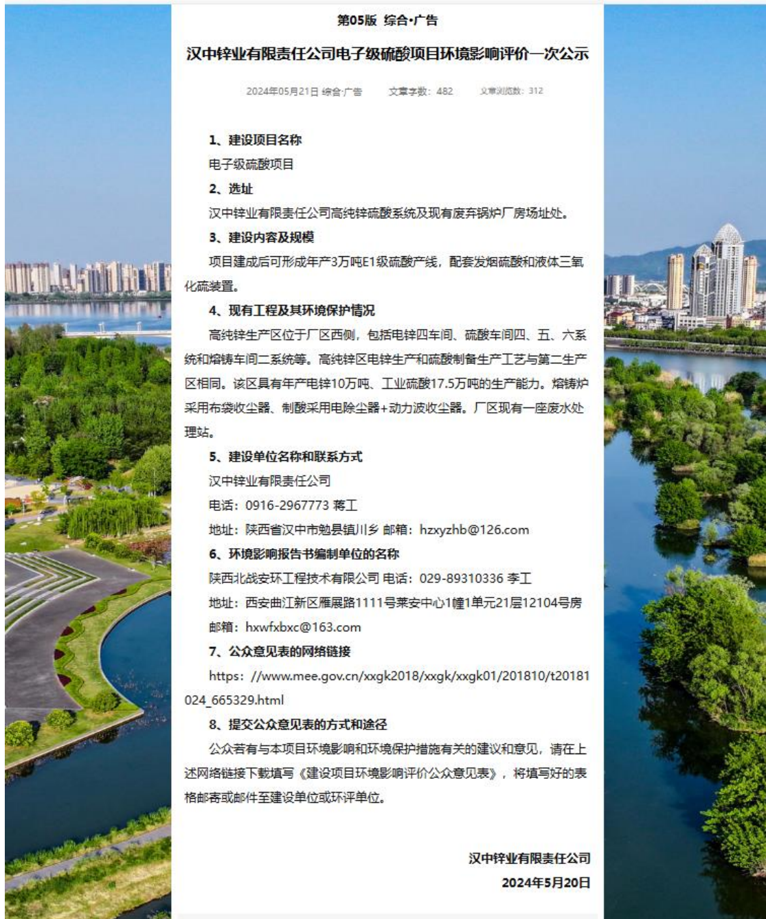
图 1 首次环境影响评价信息公开