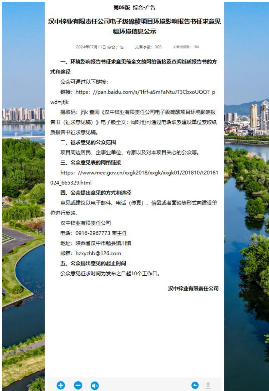
图2 项目征求意见稿网络公示截图