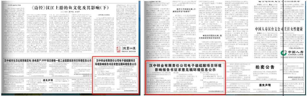
图3 项目征求意见稿报纸公示截图