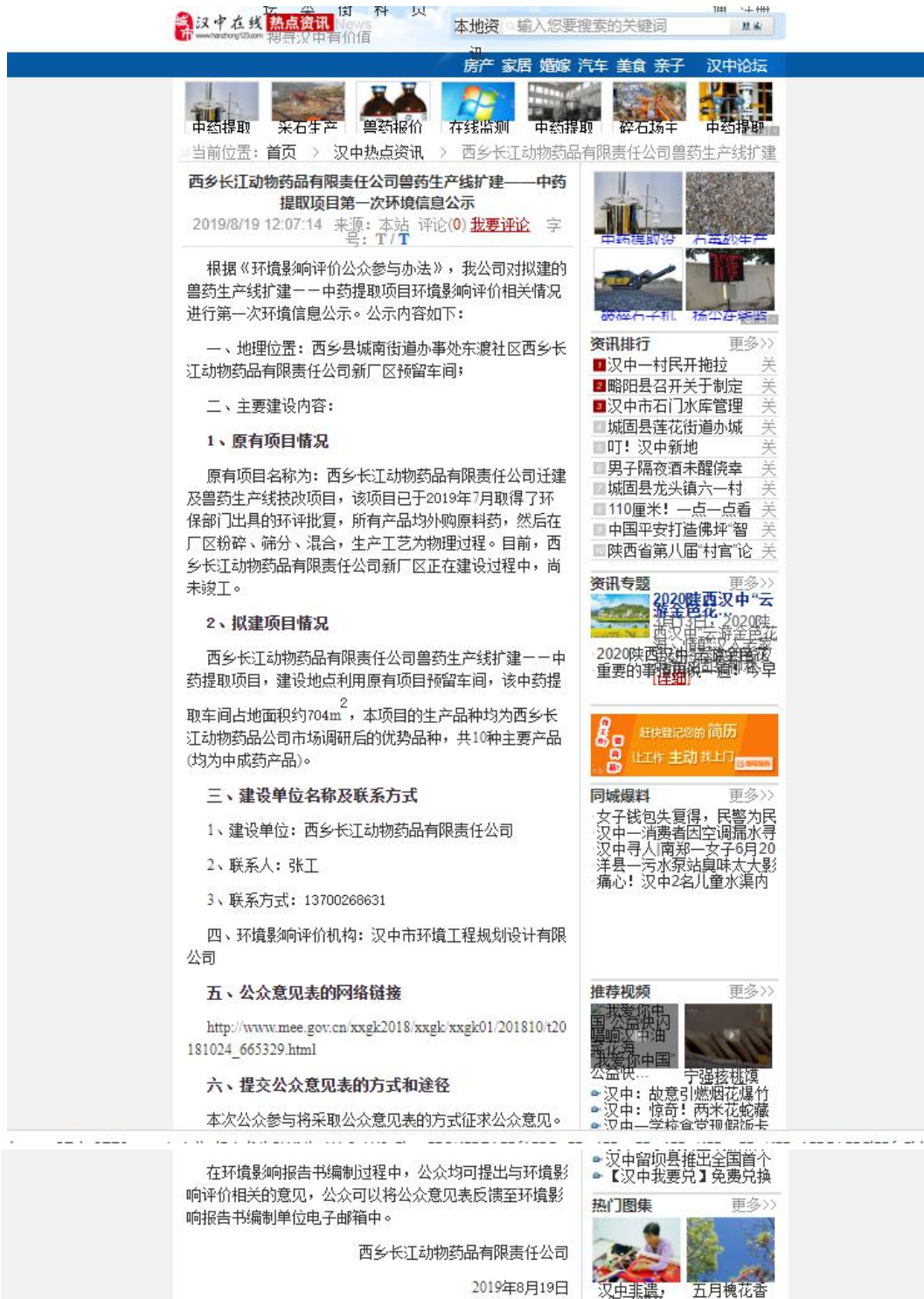
图1 首次公示网络截图