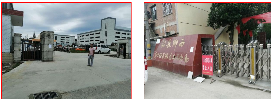
图5 征求意见稿完成后的现场张贴公示照片