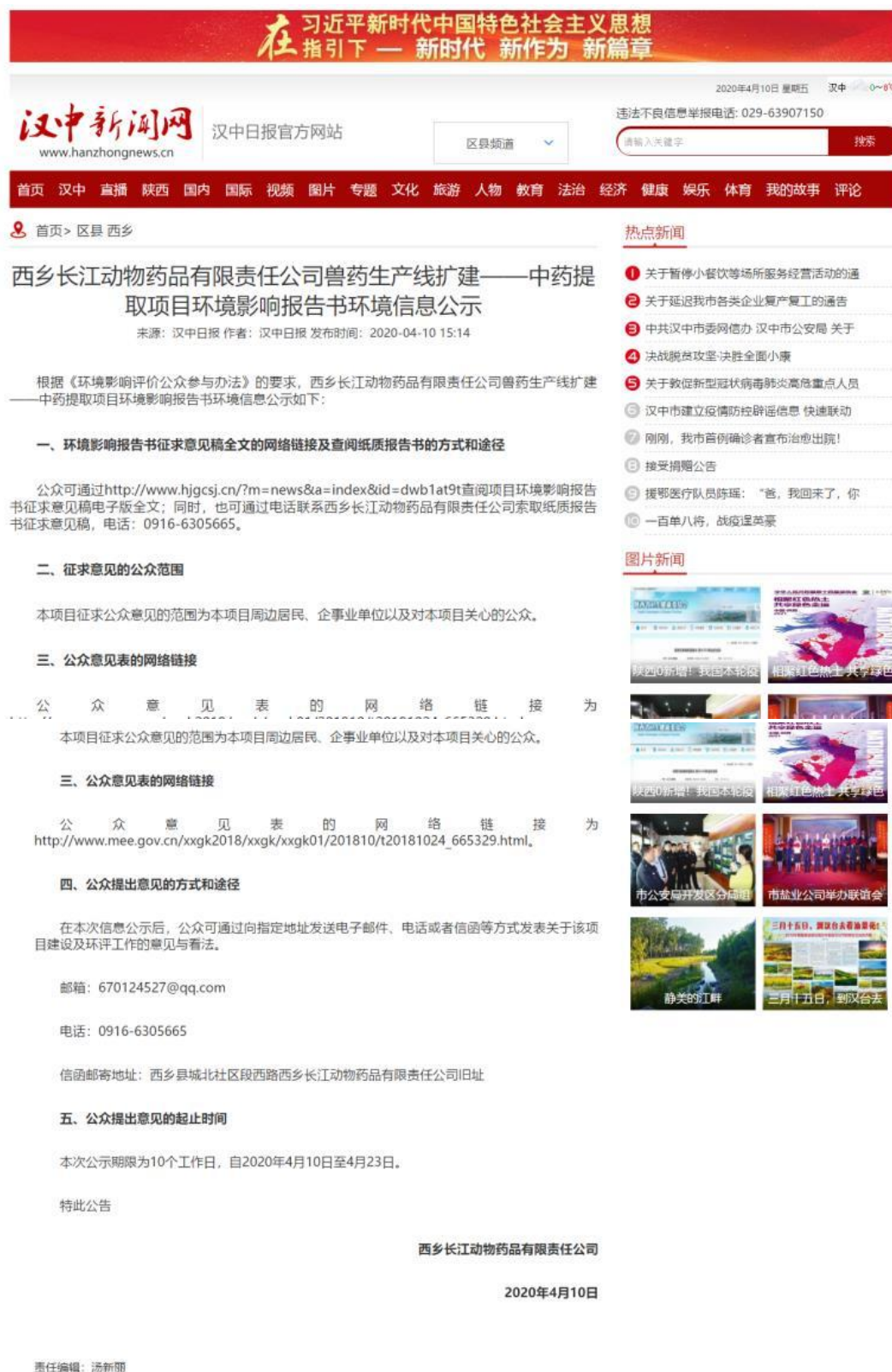
图2 征求意见稿完成之后的网络公示截图